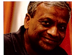
Indrasen Vencatatchellum (Isla Mauricio)

Ex Responsable Mundial del Programa de Artesanías de UNESCO, actualmente es asesor para el Programa de Culturas e Industrias Creativas de la Comisión Europea y Coordinador de la Red Internacional para el Desarrollo de la Artesanía (RIDA). Es conocido por sus numerosas iniciativas para la promoción de la artesanía en el mundo, entre ellas el “Plan de Acción Decenal 1990–1998”; el Premio Unesco y el Sello de Excelencia para la Artesanía”