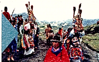
“Los colores de Tigua” Rainer Simon (Alemania/Ecuador) 45’ 2004

Sinópsis: Esta producción retrata las diversas caras de la muerte en forma secuencial. Contiene imágenes a colores que presentan la celebración de los ritos ancestrales y aún vigentes que hay en torno a la muerte en la península de Santa Elena y que datan de hace 10.000 años. Las imágenes en blanco y negro corresponden a los recuerdos de una mujer, que narra en tercera persona sus inquietudes sobre la muerte. Paralelamente se ponen de manifiesto las artes y oficios relacionados a estos rituales fúnebres.