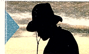
“Enlazando querencias” Talía Osorio (Colombia) 70’ 2011

Sinópsis: Evidencia el ejercicio plástico de los pintores de la comunidad de Tigua, su vida dentro de esta localidad y el desarrollo de su arte en la ciudad.