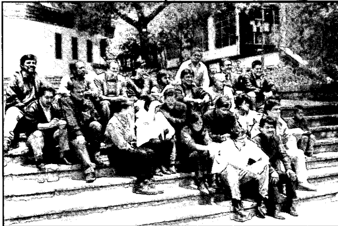
El grupo ecuatoriano