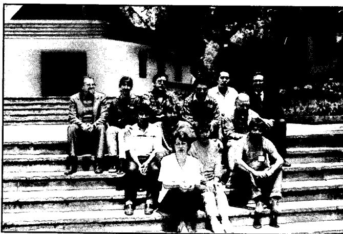
El grupo de profesores con los alumnos bolivianos.

La decisión de hacerlo así fue consciente. Era la primera experiencia y se quería asegurar todos los detalles de su organización.