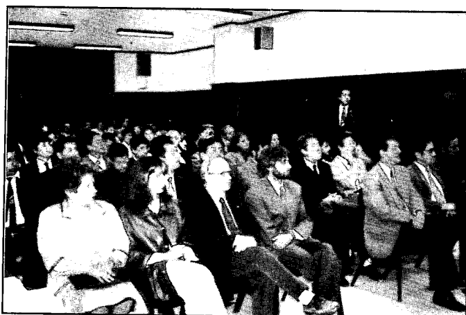
Asistentes al acto de clausura.