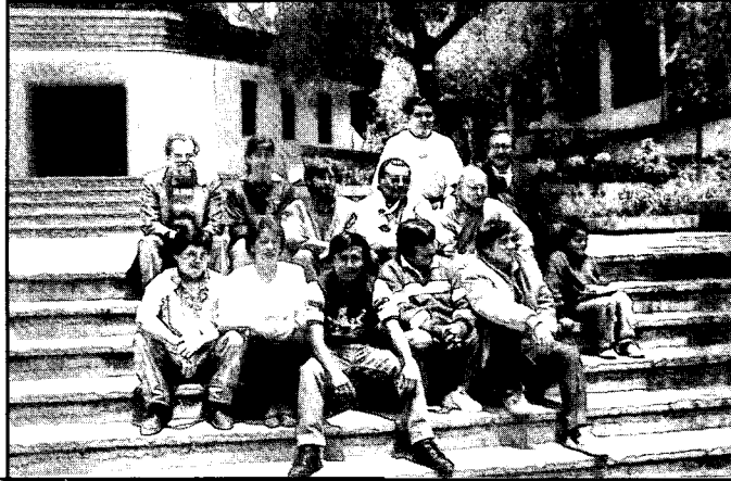
Los alumnos peruanos