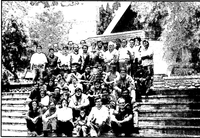
Todos quienes participamos en el curso