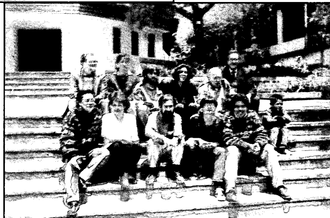
Los alumnos y alumnas de Colombia. Les acompañan profesores del curso.