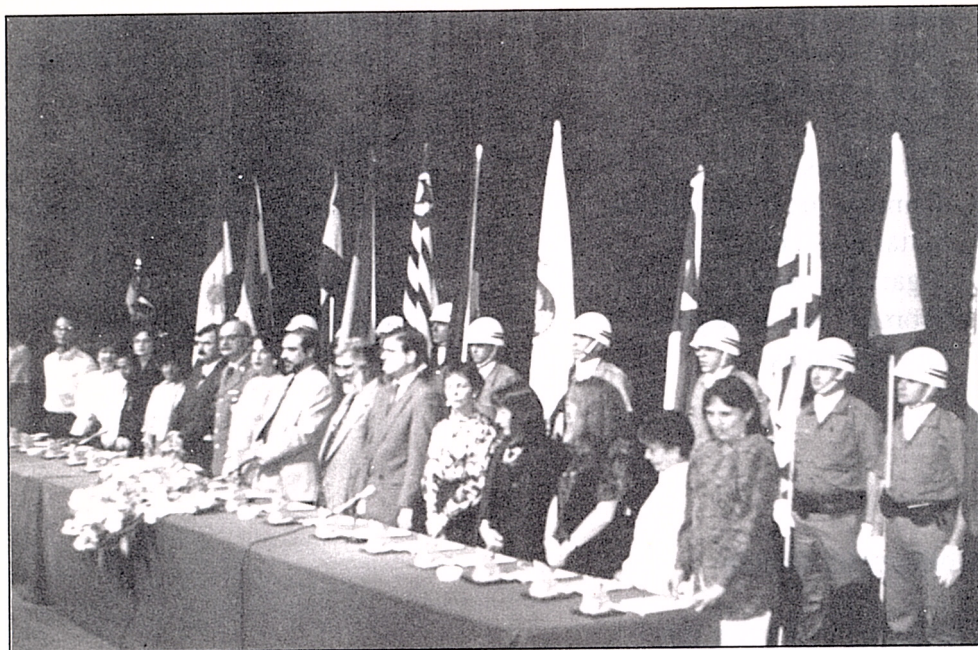
Ceremonia de Inauguración del "PRIMER ELBRIT"