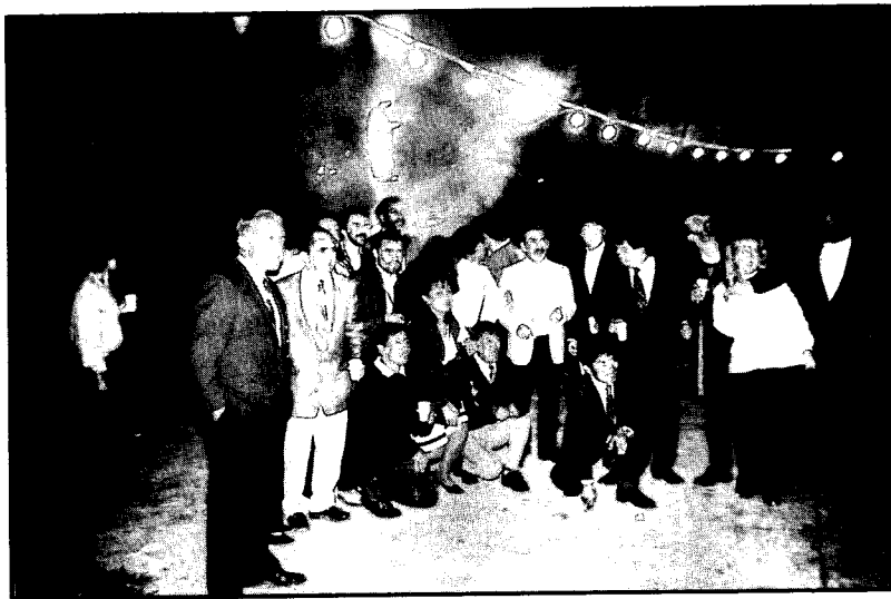
Grupo de becarios durante la inauguración del curso

Aunque sin caer en ninguna clase de exageraciones y de simplificaciones se podría resumir esta parte diciendo que el Curso tuvo un desarrollo normal y que los resultados fueron exitosos. Sin embargo, hay precisiones que es necesario hacer