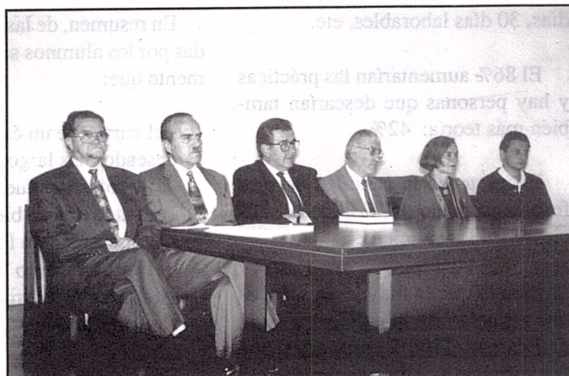
Directivos del Curso