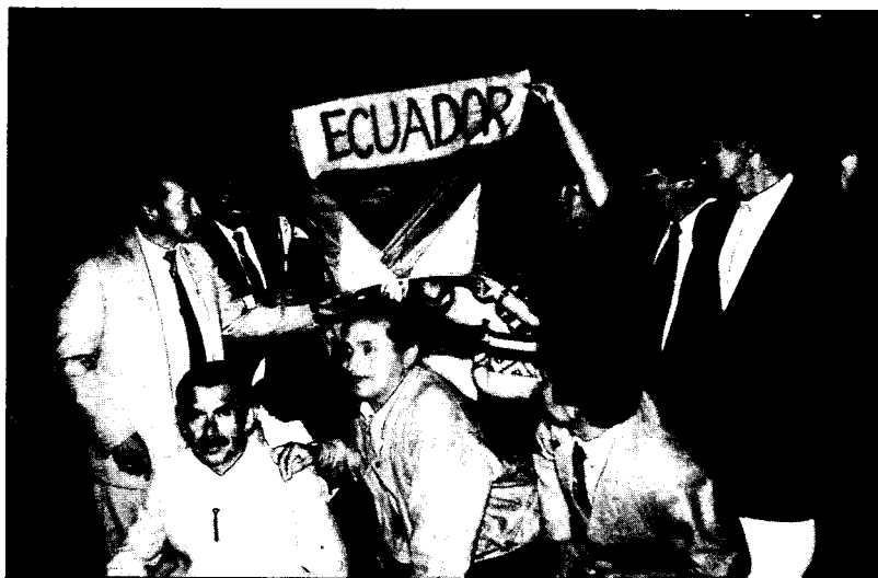
Grupo de becarios ecuatorianos en la inauguración

Vale por ejemplo indicar que los alumnos peruanos con el profesor Ingraó dedicaron horas extras para resolver algunos problemas en el curtido de las pieles de alpaca, con resultados satisfactorios.