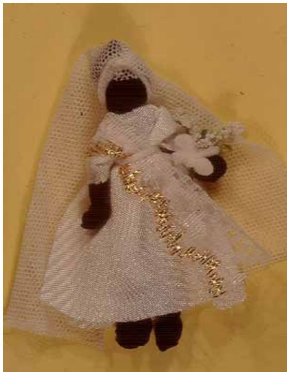
Muñecas Abayomi , Río de Janeiro, 2004.

mencioné antes, ninguna tiene facciones en el rostro, por lo tanto la negritud es expresada únicamente por medio del color de la piel, el cabello y, a veces, el vestido; los cuerpos son “esculpidos” con magnificencia hasta el último detalle. Si la representación de los y las negras en el imaginario blanco dominante es que son puro cuerpo, que son más cuerpo que intelecto, que son músculo, sensualidad, sexo y dinamismo, “una corporalidad que fascina y horroriza al mismo tiempo”, 29 tengo la sensación de que las muñecas