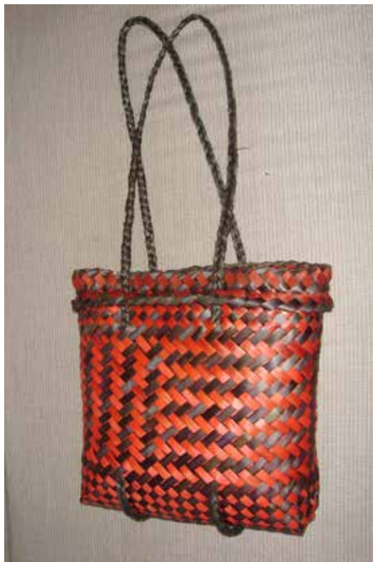
Shona Tawhiao, Canasta , lino, Auckland, 2008.

Las diferencias principales entre una kete sencilla, que es sólo para guardar cosas, y una kete whakairo es que éstas: