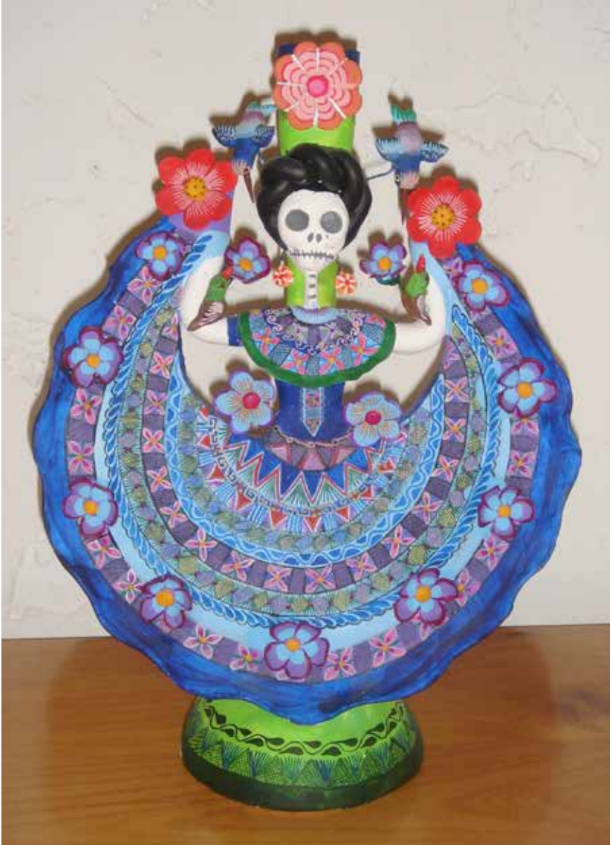
Isabel Castillo, Candlero-muerte-bailarina , barro policromado, Izúcar de Matamoros, 2009.