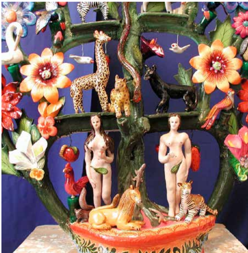
Isabel Castillo, Árbol de la vida , barro policromado, Izúcar de Matamoros.