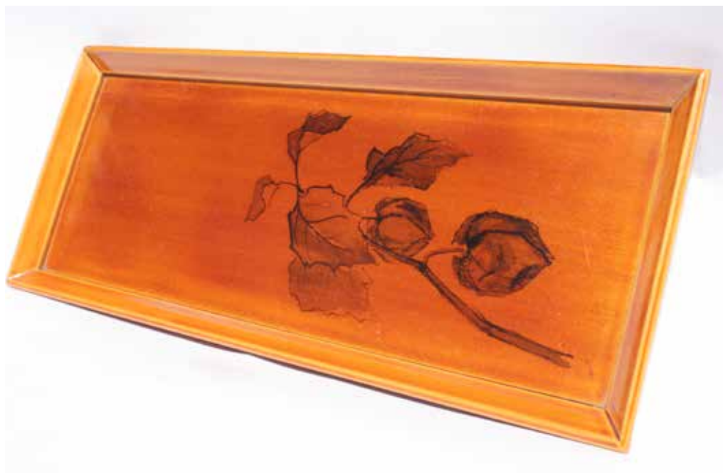
Platita Shunkei , pintada por Fusae Tabi, Tokio, 2006.