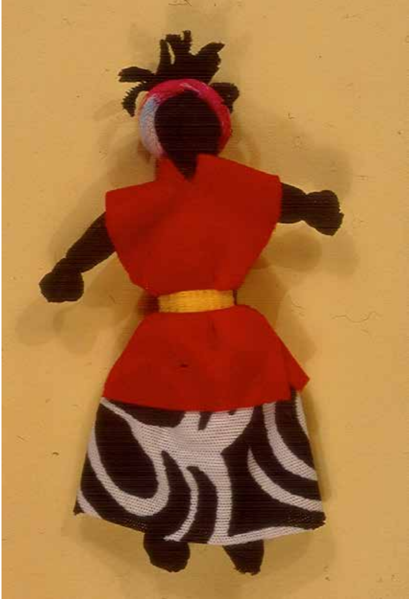
Muñeca negra , Abayomi, Río de Janeiro, 2004.