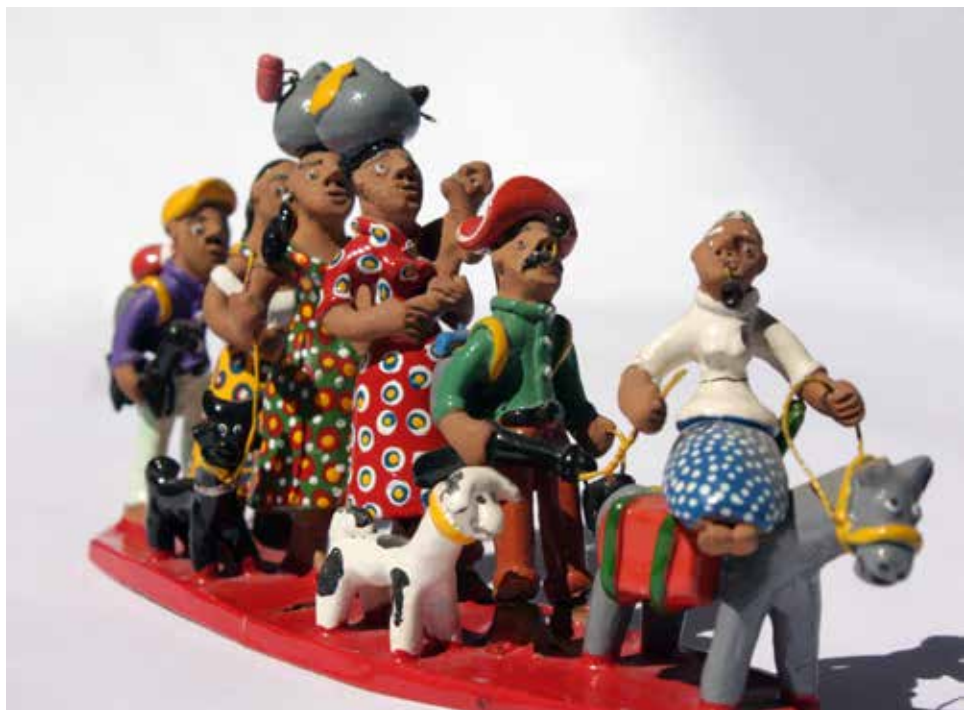
Retirantes , barro policromado, Brasil, 2004.