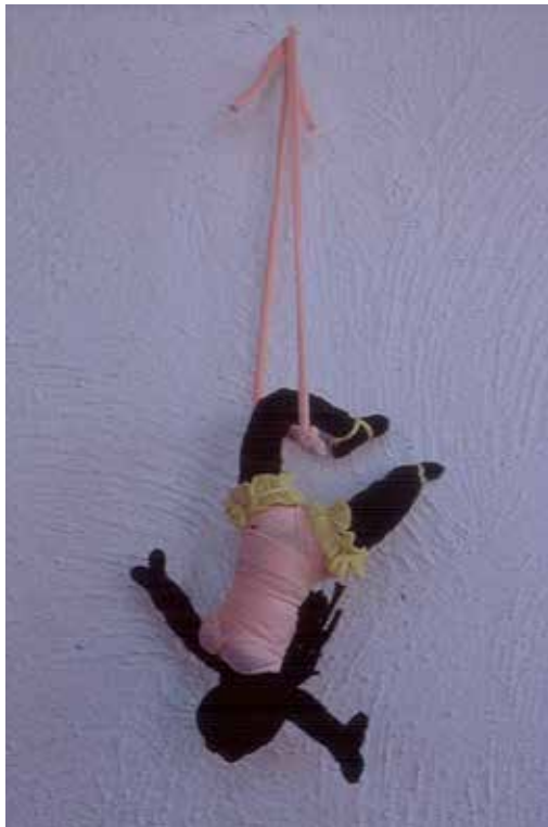
Trapecista , Abayomi, Río de Janeiro, 2004.

De los distintos tamaños hacen una enorme variedad de muñecas. Crean ángeles, negros evidentemente; hadas negras; personajes de circo: payasos, trapecistas (cabeza para abajo, vestidas de diferentes colores, con el pelo de una manera o de otra, largo o corto, con una pierna en el trapecio, se cuelgan así en la pared y se ven preciosas); personajes de la mitología; del folklore, como Curupira –personaje de cabello rojo y los pies al revés que se dedica a asustar a la gente–, santos; figuras de la vida diaria, personajes en traje folclórico de danzas regionales; brujas (con capa floreada, sombrero, calzones y zapatos rojo vino, nariz larga y retorcida, escoba, cabello largo