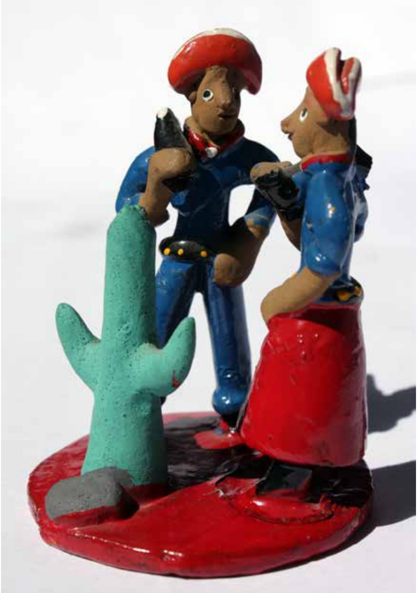
Lampião y María Bonita, Brasil, 2004.