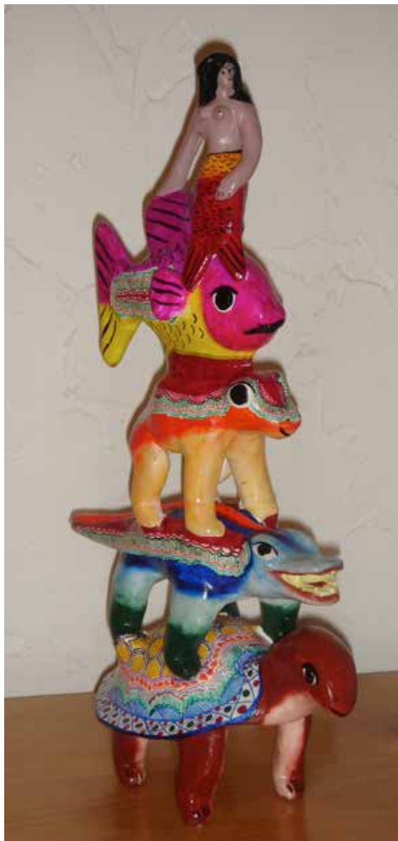
Castillo Balbuena, Torre , barro policromado, Izúcar de Matamoros.