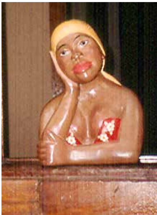
Namoradeira , madera, Minas Gerais, 2004.

Además de los animales y las figuras humanas policromadas que pueden medir hasta dos metros de altura, se hacen, en el mismo estado, unas piezas sumamente insólitas denominadas namoradeiras . Son bustos de mujeres de madera maciza de gran tamaño –alcanzan hasta medio metro– en actitud de espera, con la cabeza a veces recargada en la mano, policromadas, en colores vivos y que, a primera vista, pueden resultar chocantes porque a ciertos ojos podrían parecerles muy cursis y de mal gusto. La gran mayoría de las namoradeiras son mujeres negras muy emperifolladas y con sensuales escotes que se colocan en las ventanas de las casas. Se dice que están esperando al