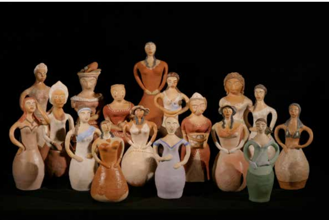
Figuras de barro, Brasil, s/f.