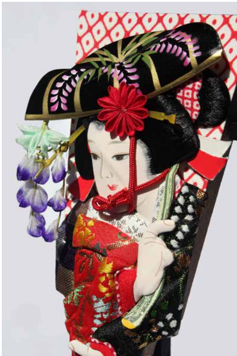
Hagoita, La doncella de la glicinia (famosa danza kabuki), 2006.