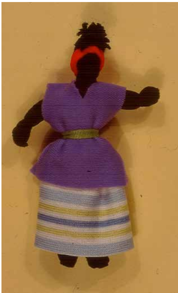
Muñeca Abayomi , Río de Janeiro, 2004.

no hay nada de arte popular que sea estrictamente de Río; entonces piensan que las muñecas Abayomi son propiamente de la ciudad con influencia africana y también europea.