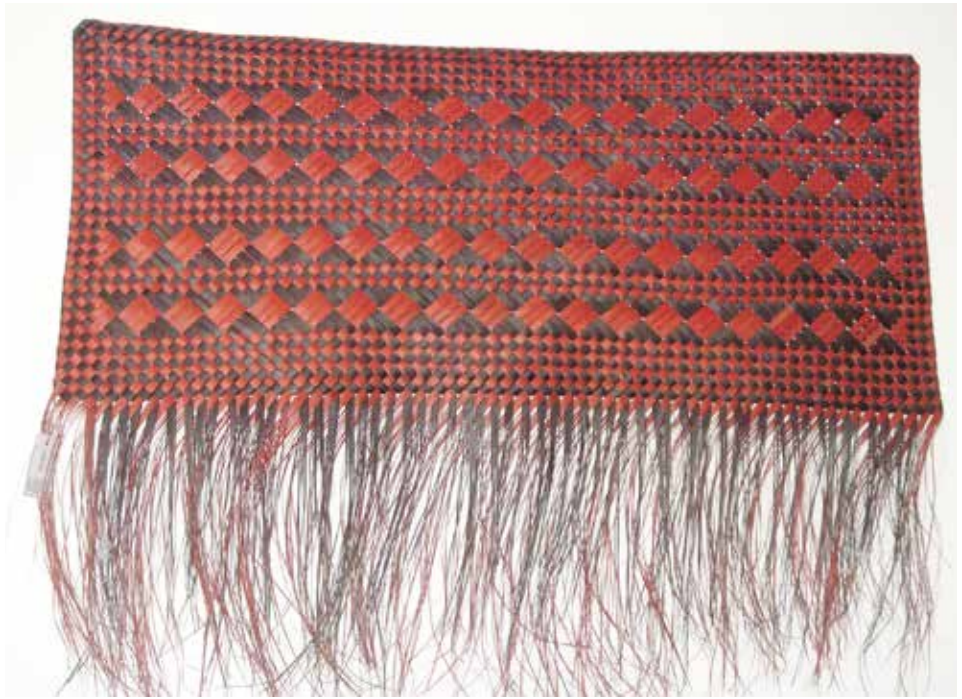
Shaona Tawhiao, adorno para la pared, lino, Auckland, 2008.