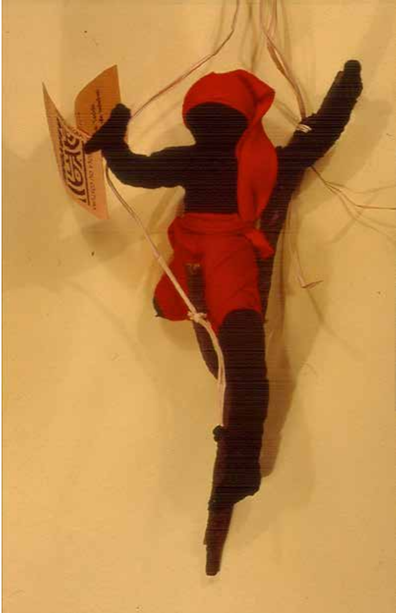
Saci-Pererê , Abayomi, Rio de Janeiro, 2004.