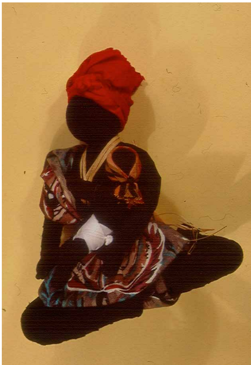
Mujer con bebé , Abayomi, Río de Janeiro, 2004.