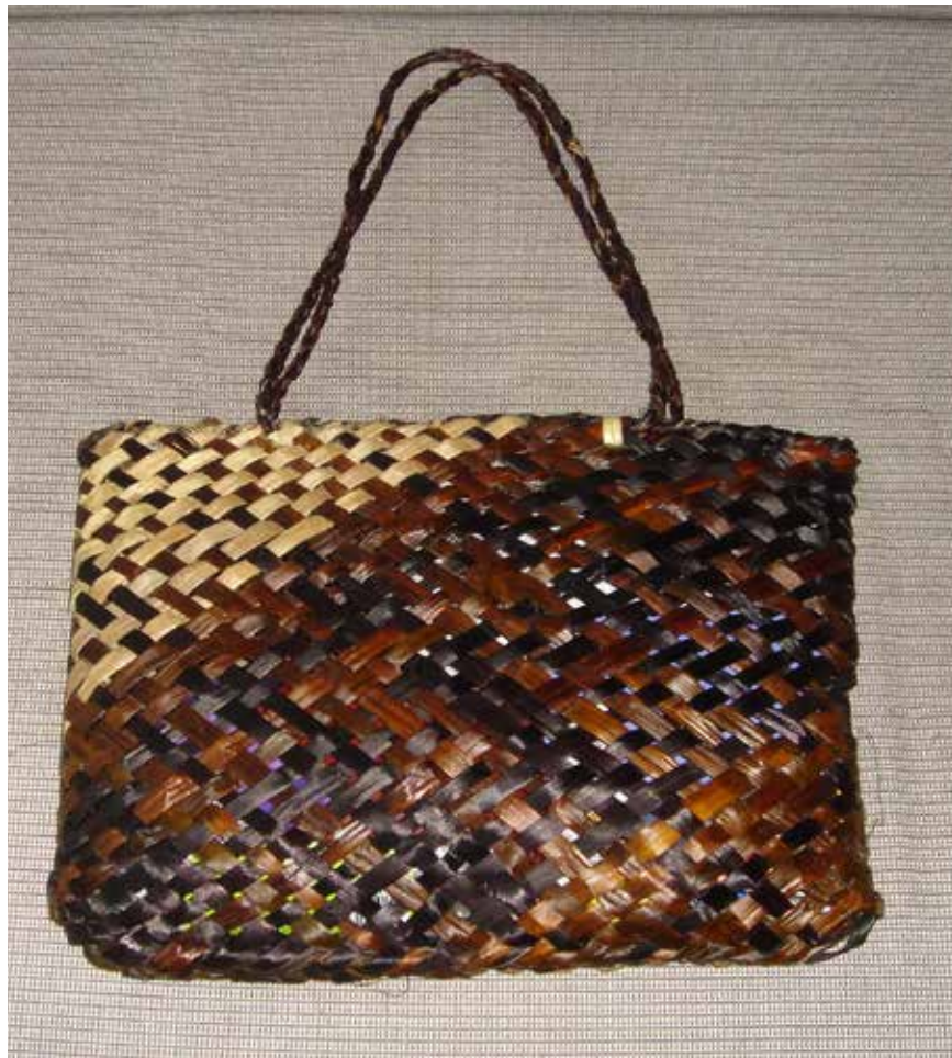
Kete , lino, Auckland, 2008.

aunque lo tradicional son las cortas, ello va variando de acuerdo con la moda predominante. Las más antiguas, por ejemplo las que se pueden ver en los museos, todas tienen las asas cortas, las que se hacen hoy tienden a llevarlas más largas para colgarlas al hombro. Desde mi punto de vista, no es posible