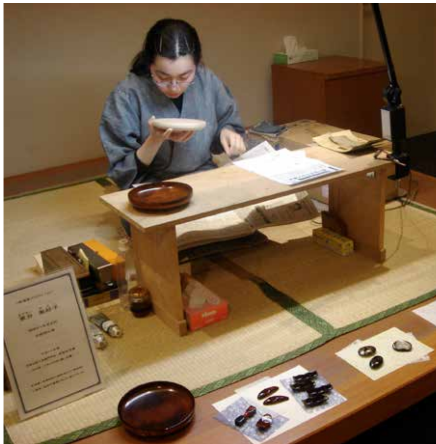
Artesana elaborando laca, Kioto, 2006.

de ahí que lo japonés adquiriera gran auge en el viejo continente. Según mencionan algunos autores, un importante impulso para que se produjera el auge del arte popular japonés fue la Exposición Universal en Viena en 1873, en la cual participó Japón. 16