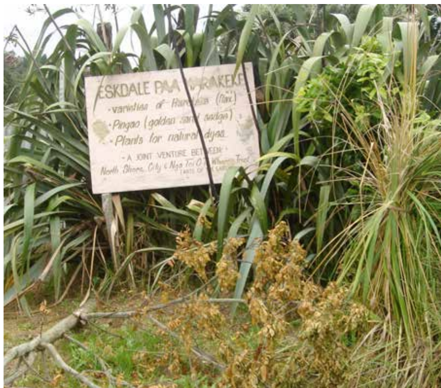
Lino frente a la casa de Judy Te Hiwi, Auckland, 2008.

Ha participado en cuatro exposiciones en veinte años, lo cual es relativamente poco. También ha participado en la elaboración de los paneles tejidos ( tukutuku ) con punto de cruz para los muros de varias marae . Esos paneles los realizó colectivamente, eran ocho mujeres en total y pasaron tres semanas elaborándolos, incluso se quedaban a dormir en la propia marae , tejían durante jornadas extenuantes. Ellas llegaban ahí y ya encontraban el material listo, en esas ocasiones no lo preparaban. También les cocinaban, lavaban y hacían la limpieza para que ellas se pudieran dedicar únicamente a tejer. “Pero ese fue el fin de una era, hoy ya no se hace así”, comenta Judy.