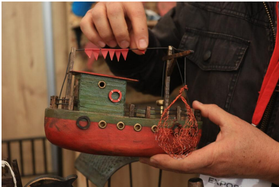
Las manos son la clave para darle forma a los elementos que se transformarán en un objeto.

Carritos, casitas, objetos para decorar surgen de las manos de Arce una vez que da forma a lo que la gente considera como desechos.