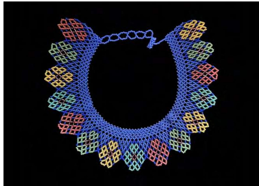
Figuras 3 y 4. Collares Nota.