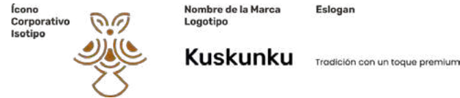
Figura 8. Composición de la marca