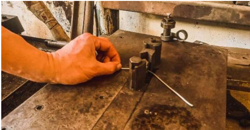
Figura 5. Doblado del material