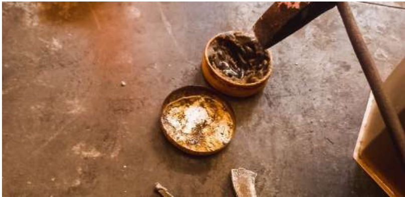
Figura 6. Soldadura