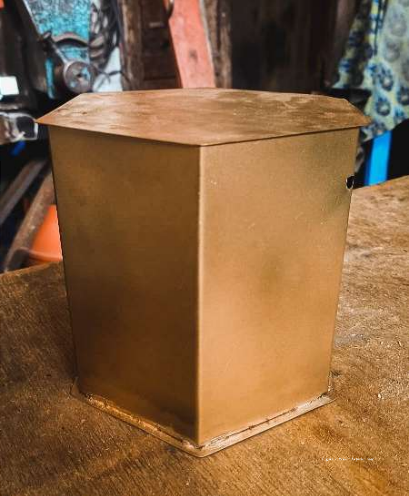
Figura 7. Resultado preliminar