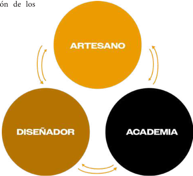
Figura 2. Interacción de participantes

Abordar esta problemática requiere una colaboración tripartita entre el diseñador, la academia y el artesano. El diseñador desempeña un papel central en la introducción de nuevas ideas e innovaciones en el proceso de diseño. La academia, por su parte, sirve como un centro de formación y desarrollo de habilidades para los artesanos, proporcionando los conocimientos técnicos y las herramientas necesarias para innovar en sus prácticas. Finalmente, el artesano aporta su valiosa experiencia técnica y conocimiento tradicional, siendo un actor fundamental en la implementación y ejecución de los proyectos de innovación.