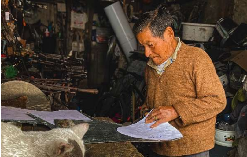
Figura 4. Plantilla para corte de tol u hojalata

Finalmente, se trabaja en promover la difusión y comercialización de estos productos en diversos ámbitos, tanto a nivel local como nacional e internacional. Para ello, se emplean estrategias de marketing efectivas, se participa en ferias y eventos culturales relevantes y se hace uso de plataformas de venta en línea para llegar a un público más amplio y diverso. En conjunto, estas acciones concretas guían el proceso de producción hacia la creación de una línea de objetos de hojalata que no solo sean estéticamente atractivos y funcionales, sino que también se conviertan en auténticos portadores de la identidad y el patrimonio cultural de Ambato. Este enfoque integral tiene como objetivo revitalizar la hojalatería como una práctica artesanal y fortalecer el sentido de pertenencia y orgullo cultural en la comunidad local.