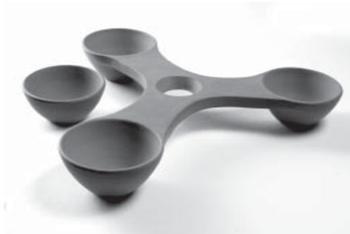
Petisqueira do Cabo.