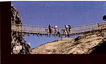
El puente de Q'eswachaka Qhapaq Ñan / Ministerio de Cultura (Perú) 20' 2014

Seguiremos a Santos en su peregrinaje a Wirikuta donde pedirá permiso a los dioses para hacer un nuevo mural, le acompañaremos en un viaje que recorrerá los 620 kilómetros de la "Ruta del Peyote". Seguiremos también el proceso creativo de Santos durante la realización del nuevo mural que ilustrará la historia, mitología, y prácticas religiosas del pueblo huichol.