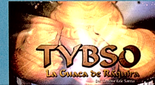
Tybs: La Guaca de Ráquira Paonius Professio Ingenieros Consultores (Colombia) 20' 2014

Sinopsis: "El puente Q'eswachaka", sus características, atributos y valores fueron determinantes para postular a la lista de Patrimonio Mundial de la UNESCO. Ubicado en la Provincia de Canas, forma parte de la red vial que comunicaba la Ciudad del Cusco con la región altioplánica. Este puente constituye uno de los principales elementos del camino para la época Inca y una de las obras de ingeniería donde se aplicó inigualables tecnologías constructivas que fueron replicadas en el Tawantinsuyu.