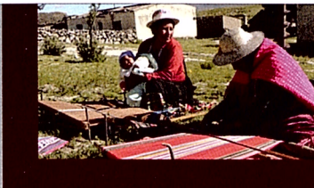
Tejiendo Relatos Sebastián Riveaud & Clara Calvet (Argentina - España) 57' 2015

Sinopsis: Cuatro personajes que han dedicado gran parte de su vida a fabricar "años viejos" nos cuentan sus historias y a través de ellas, y de los muñecos que fabrican, nos internamos en la ciudad de Guayaquil en proceso de "regeneración urbana". ¿Qué fuego interior anima a nuestros personajes a regresar cada año a la fabricación de estos muñecos que en la media noche del 31 de Diciembre terminarán su corta vida entre las llamas, en todos los barrios de esta ciudad históricamente moldeada por el fuego?