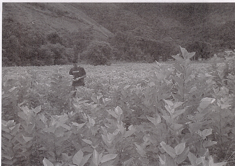
Cultivo de morera.