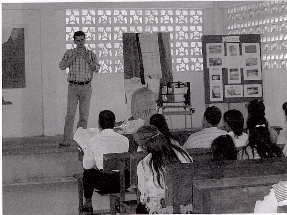
Cursos de Capacitación.