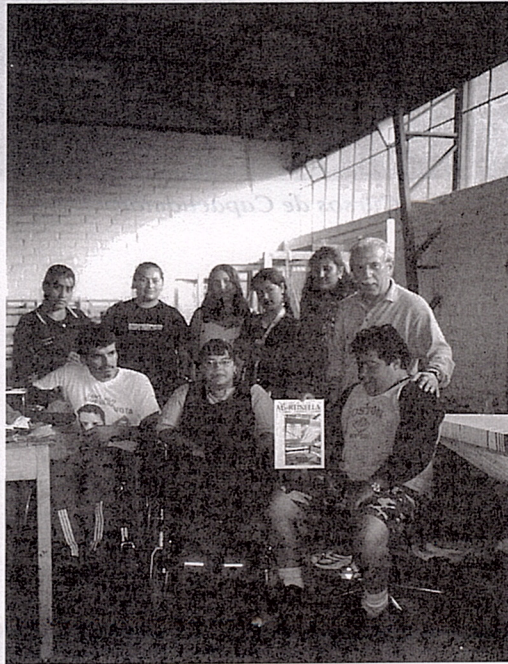
Alumnos de cursos.