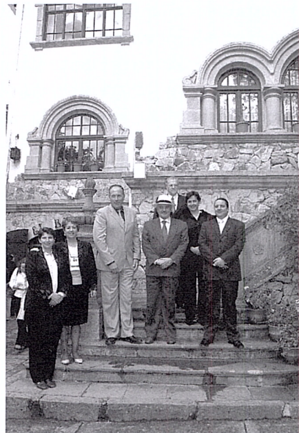
Los Ministro de Estado: Gobierno, Turismo, y Obras Públicas visitaron la III Feria Nacional Excelencia Artesanal