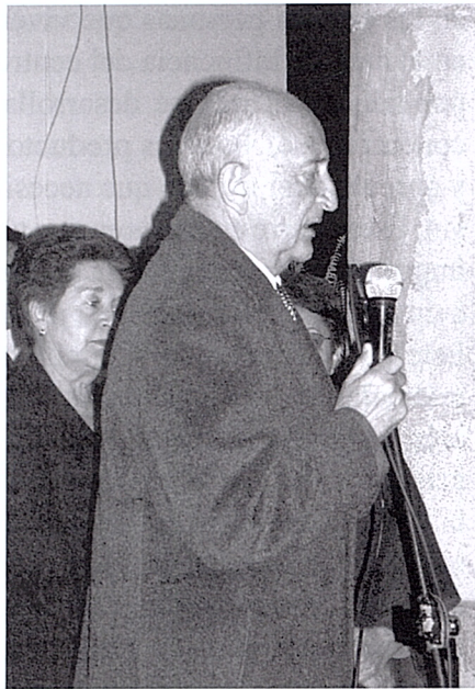
Inaugura la Feria el Dr. Alejandro Serrano Aguilar, Vicepresidente Constitucional de la República del Ecuador.

Dentro de esta óptica las ferias tienen vigencia en el mundo